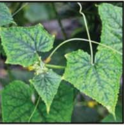
ជំងឺមូសាអ៊ិក