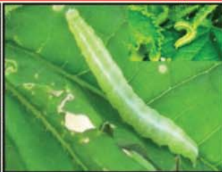
ដង្កូវមូរស្លឹក