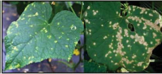
ជំងឺលឿងទុំស្លឹក