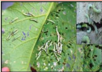
ដង្កូវកាត់ស្លឹក