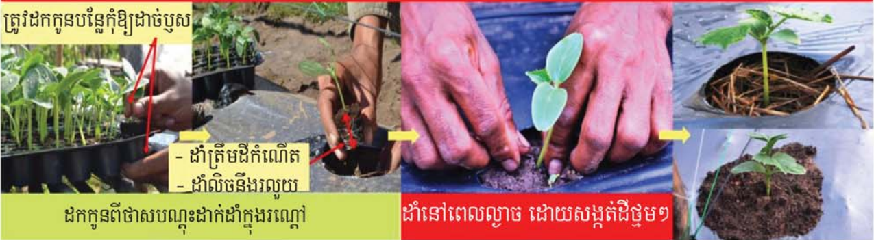
ត្រូវដកកូនបណ្តុះកុំឱ្យដាច់បូស