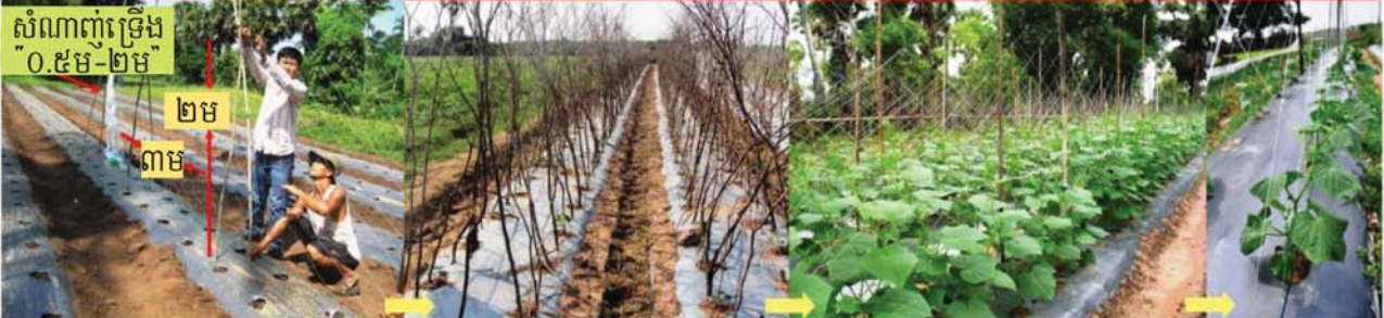
សំណាញ់ទ្រើង "០.៥ម-២ម"