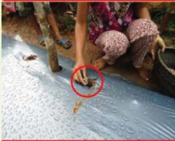
ដាក់ជ័រមាសទ្រាប់បាត មុនដាំ រយៈពេលពី៥ទៅ៧ ថ្ងៃ