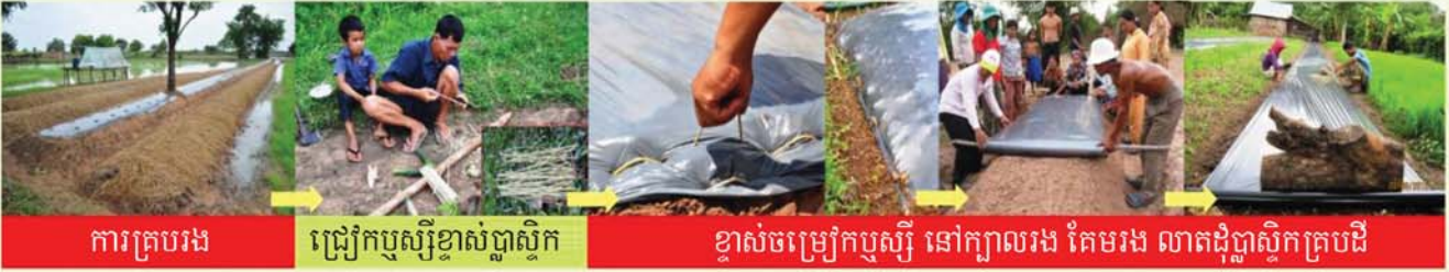
ការគ្របរង