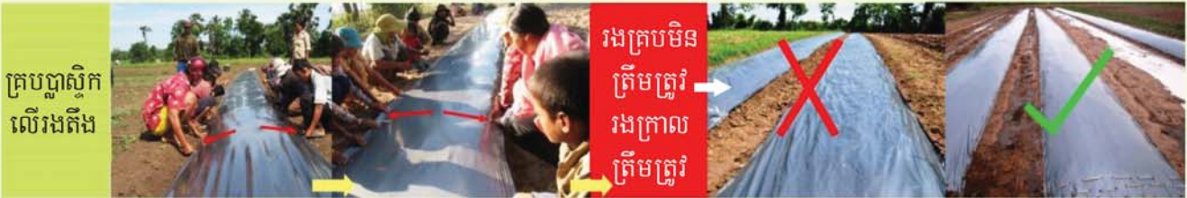
គ្របបញ្ជាស្លឹកលើរងតឹង