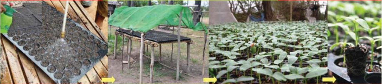
ក្រោយបណ្តុះរួច ត្រូវស្រោចទឹក