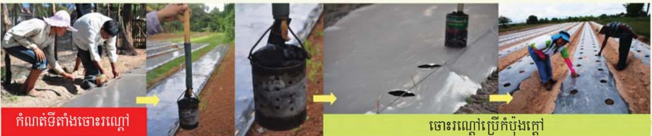
កំណត់ទីតាំងចោទរណ្តៅ