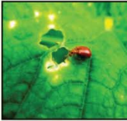
អណ្តើកមាស