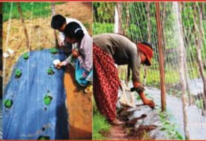
ដាក់ជ័របំប៉ន នៅអាយុ៧-២១ថ្ងៃ