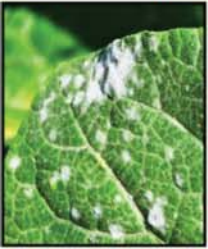
ជំងឺផ្សិតមេក្រា