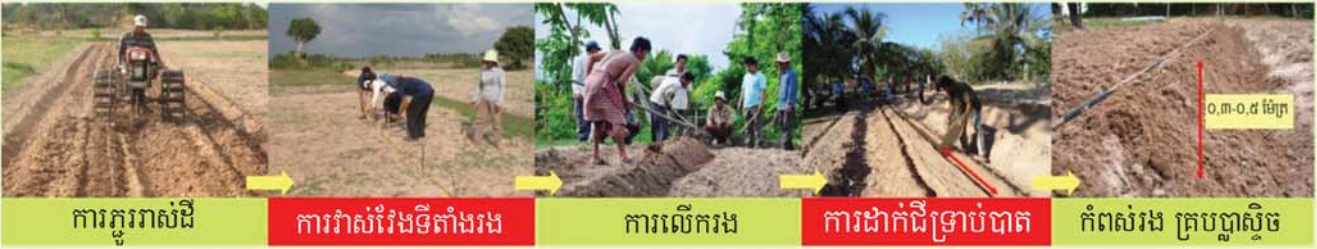
ការគ្រួររាស់ដី