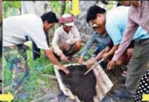
លើងល្បាយដី និងដី