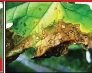
ជំងឺអុចស្លឹក