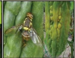
ដង្កូវចោះផ្លែ