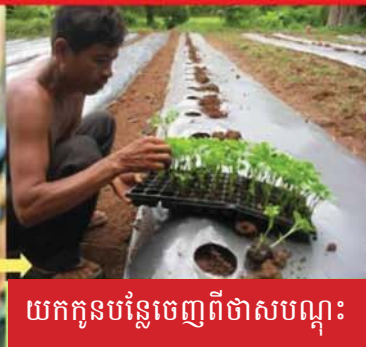
យកកូនបន្លែចេញពីថាសបណ្តុះ