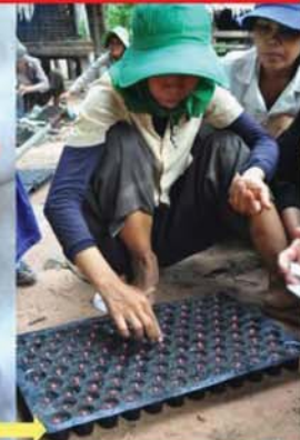
ដាក់១ គ្រាប់ ក្នុង ១ រន្ធ