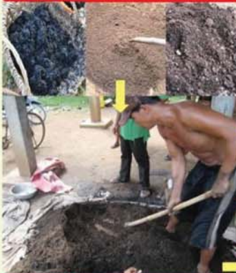
ការលាយគ្របលំដីសម្ងាស់