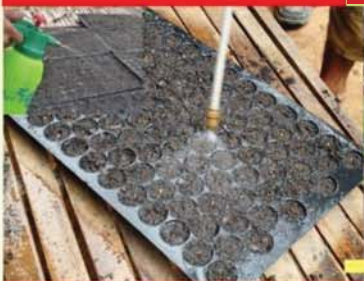
ស្រោចទឹកក្រោយដាក់គ្រាប់ចូល