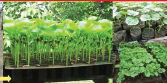
កូនម្រះ អាយុ ៨-១០ ថ្ងៃអាចយកទៅដាំបាន