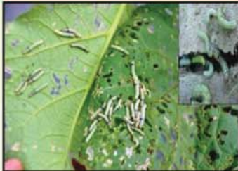
ដង្កូវកាត់ស្លឹក