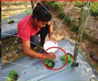
ដាក់ជីបំប៉នក្រោយដាំ៧-២១ ថ្ងៃ ចម្ងាយ២០cm