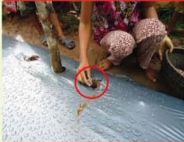
ដាក់ជីសមាសទ្រាប់បាតមុន ពេលដាំ៥-៧ថ្ងៃ