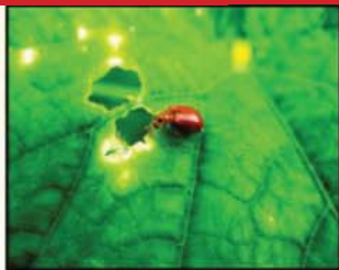
អណ្តើកមាស