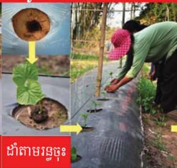
ដាំតាមរន្ធចុះ