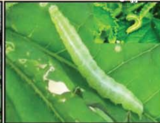
ដង្កូវមូស្លឹក