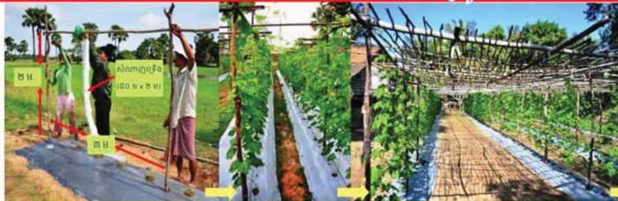
ត្រូវធ្វើរងមុនពេលដាំ ដើម្បីឲ្យកូនបន្លែលូតលាស់បានឆាប់ ប្រើបង្គោលឬស្សី ឬ មែកឈើដែលមានស្រាប់ក្នុងមូលដ្ឋាន

រៀបចំដោយ: គម្រោងបង្ហាញបច្ចេកវិទ្យាដើម្បីបង្កើនផលិតភាពជុំវិញតំបន់ទន្លេសាប(TSTD-TA 735-CAM)