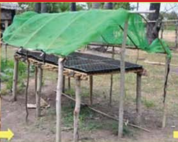
រោងសំណាញ់ដាក់កូនបណ្តុះ