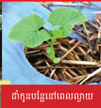
ដាំកូនបន្លែនៅពេលល្ងាយ