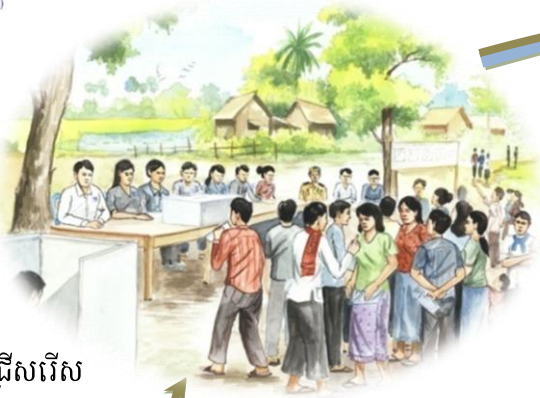
៣. បោះឆ្នោតជ្រើសរើស គណៈកម្មការ គ្រប់គ្រងស្រះជម្រកត្រី

សហគមន៍កម្ពុជា កម្ពុជា FAO EU Food Facility Project (GCP/C/MB/033/EC)