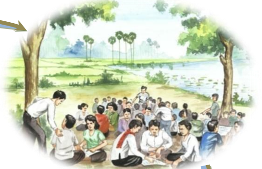
៥. ប្រជុំពិគ្រោះយោបល់ រៀបចំផែនការ គ្រប់គ្រងស្រះជម្រកត្រី