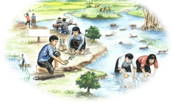
៧. គ្រប់គ្រង និងកែលម្អ ស្រះជម្រកត្រីសហគមន៍