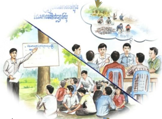
៦. បញ្ជ្រាបផែនការគ្រប់គ្រងស្រះជម្រកត្រីសហគមន៍ទៅក្នុងផែនការអភិវឌ្ឍន៍ឃុំ