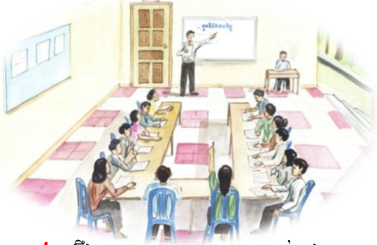
៤. ពង្រឹងសមត្ថភាពគណៈកម្មការគ្រប់គ្រង ស្រះជម្រកត្រី