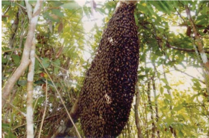
ការចិញ្ចឹមឃ្មុំក្នុងព្រៃសហគមន៍

អ្នកភូមិបានដឹកទឹកឃ្មុំទៅលក់ផ្ទាល់នៅសណ្ឋា