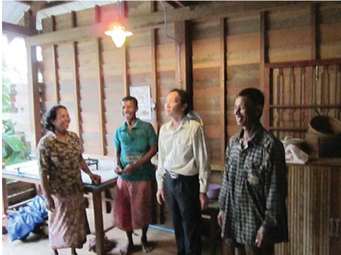
ចង្កៀងដែលប្រើដោយថាមពលពីឡូជីវិកស្ថាន

ប្រយោជន៍ឡូជីវិកស្ថានដល់ប្រជាពលរដ្ឋនៅភូមិដទៃៗ ទៀត។