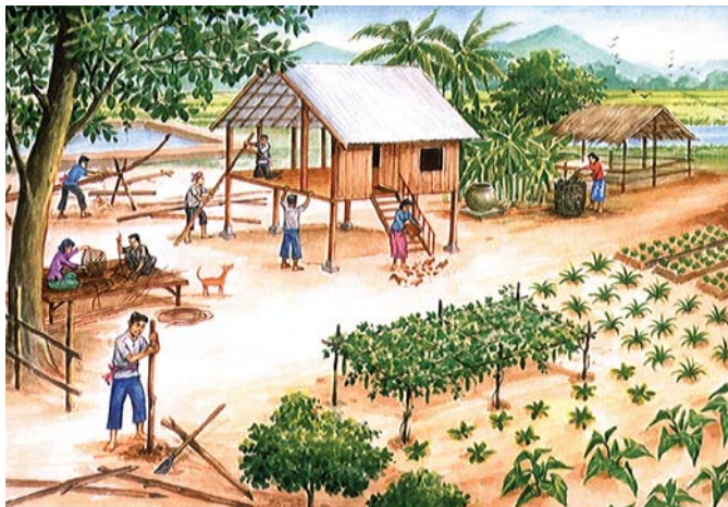
រូបគំរូនៃការអនុវត្តប្រព័ន្ធកសិកម្មចម្រុះ

កសិករ៩៥ គ្រួសារ បានទទួលពូជស្រូវ ៩៥០ គីឡូក្រាម (រួមមានពូជ ស្រូវរាំងជ័យ ផ្ការដេង ផ្ការដួល ផ្កាចាន់សែនស ជលសារ និងសែនពិដោរ)ដើម្បីយកទៅ ដាំដុះលើផ្ទៃដីចំនួន ៥២ ហិកតា ក្នុងនោះការអនុវត្ត ស្រែប្រពលវប្បកម្មចំនួន ២០,៣០ ហិកតា។ នេះជាផ្នែក មួយនៃការអនុវត្តវិធានការគោលនយោបាយ កំណត់ ប្រភេទស្រូវសំខាន់ៗក្នុងស្រុក និងជំរុញផលិតកម្មដំណាំ ស្រូវ ។