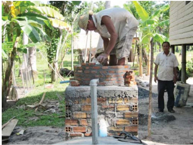
ទិដ្ឋភាពការសាងសង់ឡដីវឌ្ឍន៍ (ដែលផ្តល់ថាមពលអាចកាត់បន្ថយការប្រើប្រាស់ថាមពលពីព្រៃឈើ )