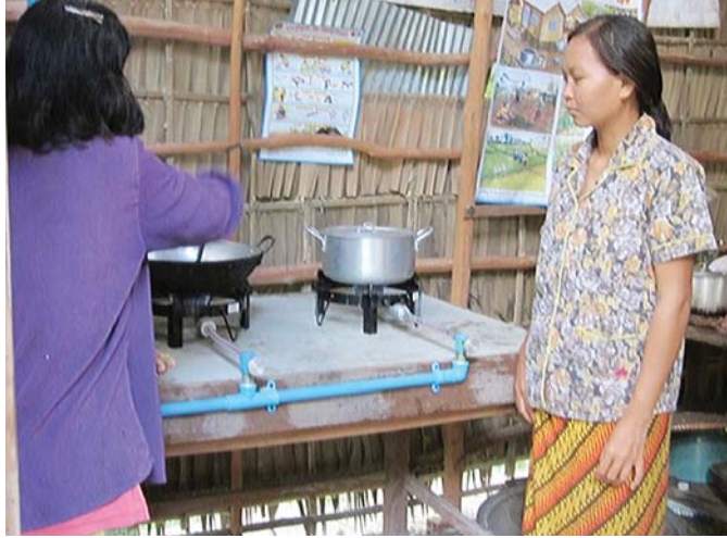
ការចម្អិនអាហារដោយប្រើថាមពលពីឡដីវឌ្ឍន៍មន្ទីរកសិកម្មខេត្តសៀមរាប។ គម្រោងបានជ្រើស រើសសហគមន៍ព្រៃឈើភូមិត្បែងលិចដោយផ្អែកលើគោលការណ៍ដូចខាងក្រោម

កសិករបានទទួលឡដីវឌ្ឍន៍ចំនួន ១៣គ្រួសារពីគម្រោង។ លទ្ធផលជាក់ស្តែងកសិករចំណេញពេលវេលាកាត់បន្ថយការកាប់ព្រៃឈើ ធ្វើអុសដុតចម្អិនអាហារ និងបានកាកសំណល់ពីឡទៅដាក់ដាំ បន្លែ និងដាំស្រូវបន្ថែមទៀតជំរុញឲ្យដំណាំដុះលូតលាស់ល្អ។ លើសពីនេះសហគមន៍ព្រៃឈើភូមិត្បែងលិចយ៉ូត្បែងស្រុកបន្ទាយស្រីត្រូវបានជ្រើសរើសសម្រាប់អនុវត្តគម្រោងឡដីវឌ្ឍន៍របស់ មូលនិធិគ្លីនតុន។ ក្នុងនោះឡដីវឌ្ឍន៍ចំនួន ០៨ នឹងត្រូវសាងសង់សម្រាប់ផ្តល់ជូនសមាជិកសហគមន៍ ០៨គ្រួសារ។ កិច្ចសន្យា សាងសង់ឡដីវឌ្ឍន៍ត្រូវចុះហត្ថលេខាដោយខណ្ឌរដ្ឋបាលព្រៃឈើសៀមរាប និង