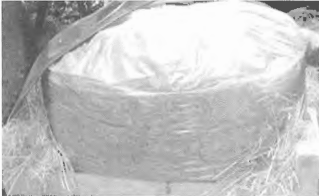
អ៊ុន និង រសជាតិ ។

តាមទំលាប់នៅរដូវដែលខ្វះចំណីខ្លាំង កសិករច្រើន ផ្តល់ចំបើងឱ្យគោ-ក្របីគាត់ស៊ីជាអាហារបន្ថែម ព្រោះវាជា ចំណីដែលមានស្រាប់នៅគ្រប់គ្រួសារ។ ប៉ុន្តែ ដូចដែលយើងដឹង ស្រាប់ហើយនៅក្នុងចំបើងមានសារធាតុចិញ្ចឹមតិចណាស់ វា មានប្រូតេអ៊ីនតែ ២-៤% ម្សៅ និង ខ្លាញ់ទាប ហើយថែមទាំង មានជាតិសរសៃច្រើន ដែលធ្វើឱ្យក្រពះសត្វពិបាករំលាយ។ ប៉ុន្តែ យើងអាចកែច្នៃវាដោយធ្វើជាចំបើងផ្កាប់ ដើម្បីបង្កើនទាំងប្រូតេ