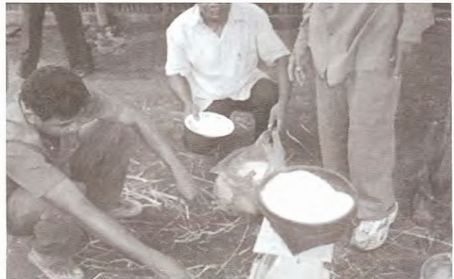
ការរៀបចំល្បាយជីអុយរ៉េជាមួយទឹកសម្រាប់ស្រោចលើចំបើង