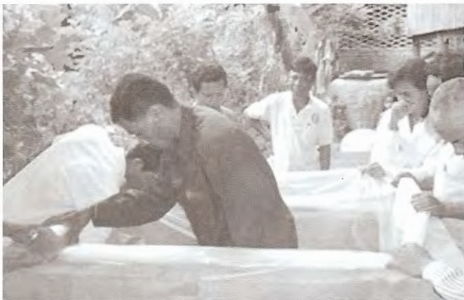
ការរៀបចំកន្លែងសម្រាប់ធ្វើចំបើងផ្គាប់