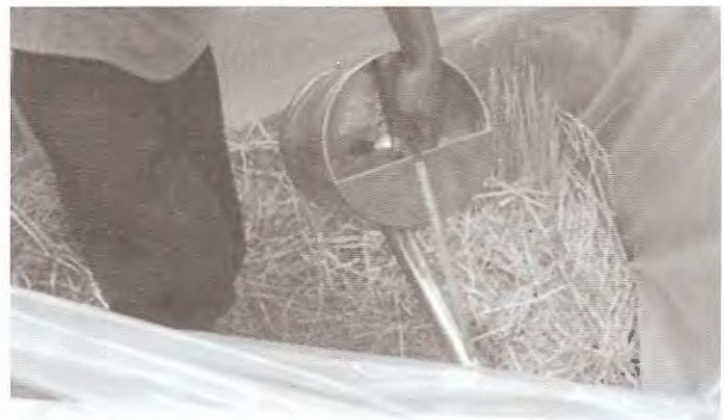
ការស្រោចល្បាយជីអុយរ៉េ