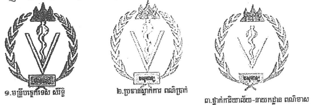
១. មន្ត្រីបច្ចេកទេស សិរីឌី