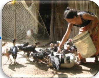
ច្របល់ចំណីចូលគ្នា