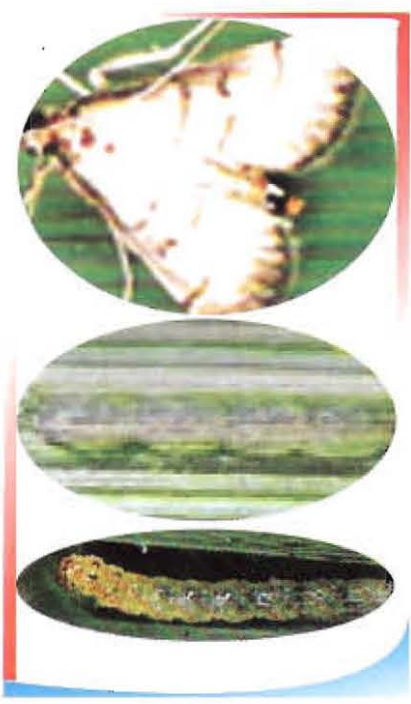
ដង្កូវមូរស្លឹកបំផ្លាញដំណាំស្រូវ