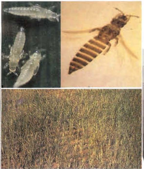
ទ្រីបបំផ្លាញដំណាំស្រូវ