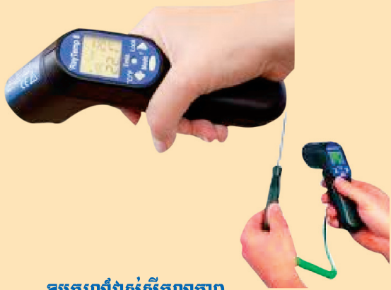
ឧបករណ៍វាស់សីតុណ្ហភាព