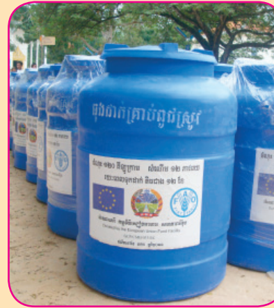
ត្រង់បិទជិត