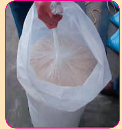
ចង់បិទជិត