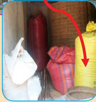
ការទុកដាក់ស្រូវក្នុងក្នុងបារ រួចដាក់ក្បែរសរសរក្នុងផ្ទះ