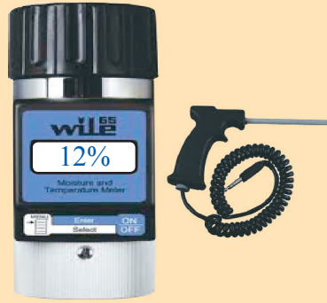
ឧបករណ៍វាស់សំណើម និងសីតុណ្ហភាព