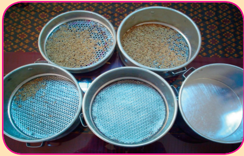
កញ្ចែងរែងសត្វល្អិត និងសារធាតុចម្រាយឡ