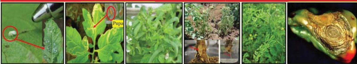
រុយស ដង្កូវស៊ីញ៉ៅ ប្រើដំបាយ ជំងឺស្រពោន ជំងឺរញ្ជូលឈៀង ជំងឺអង់ត្រាកណ្តុស