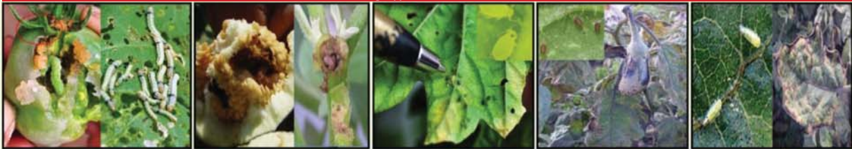
ដង្កូវស៊ីផ្លែ និងស្លឹក ដង្កូវស៊ីរូងផ្លែ និងក្រូច ចៃ ពីងពាងក្រហម មាចាខៀវ