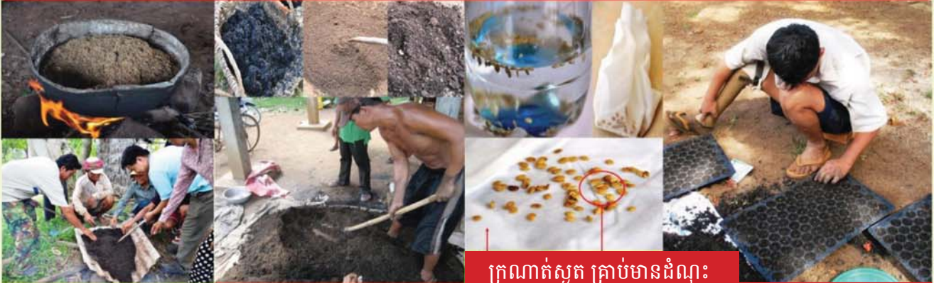
លីងឈ្មាយដី ដីសរីរាង្គ សម្រាប់បណ្តុះកូន