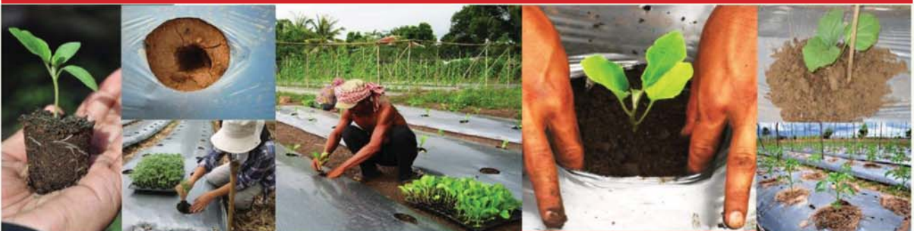
យកកូនបន្លែចេញពីថាសកុំឲ្យដាច់ឫសដាក់ដាំ