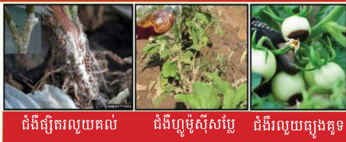
ជំងឺផ្សិតរលួយគល់ ជំងឺហ្គម្ពូស៊ីសប្លែ ជំងឺរលួយធូរតូទ