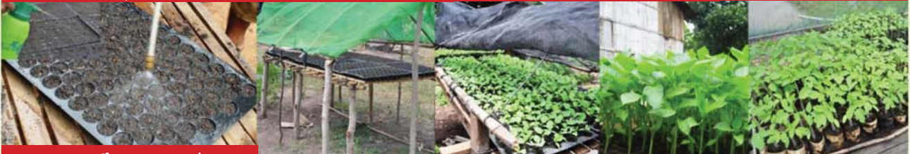
ស្រោចទឹកក្រោយដាក់ គ្រាប់ និងដាក់ក្នុងរោង