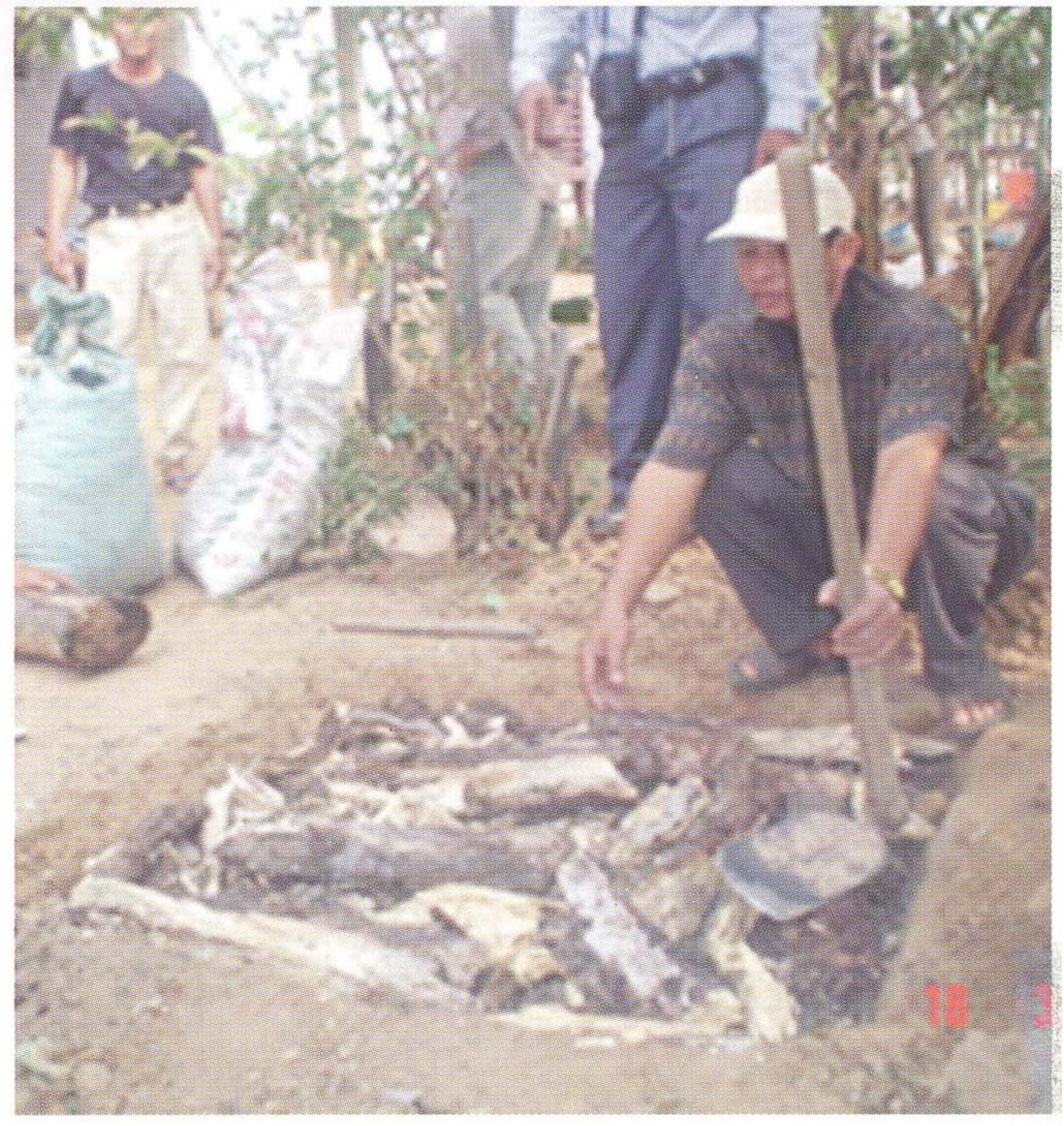
ការដាក់កំទេចកំទីនិងស្លឹកឈើស្ងួត ពីលើគំនរឈើ

* នៅបាតរណ្តៅ ត្រូវដាក់ដីលាមកគោស្នូតដោយ បរិមាណសមល្មម ។