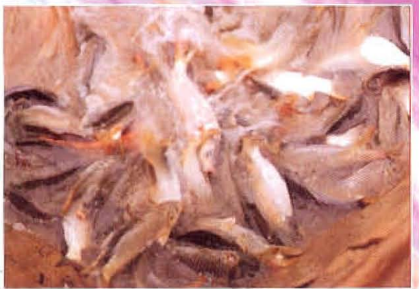
សត្វត្រីក្នុងស្រែ