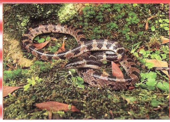
ប្រភេទសត្វពស់ស៊ីកណ្តុរ

សត្វពស់ និងសត្វស្លាបមួយចំនួនរួមទាំងទីទុយគឺជាសត្វប្រដាប់ទ័ពយ៉ាងសំខាន់ក្នុងការកំចាត់សត្វកណ្តុរដើម្បីការពារស្រូវជូនកសិករ ។