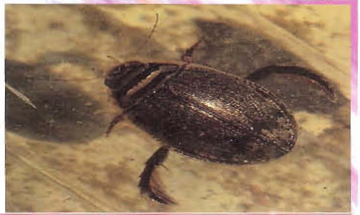
សត្វកន្លោះឡុង