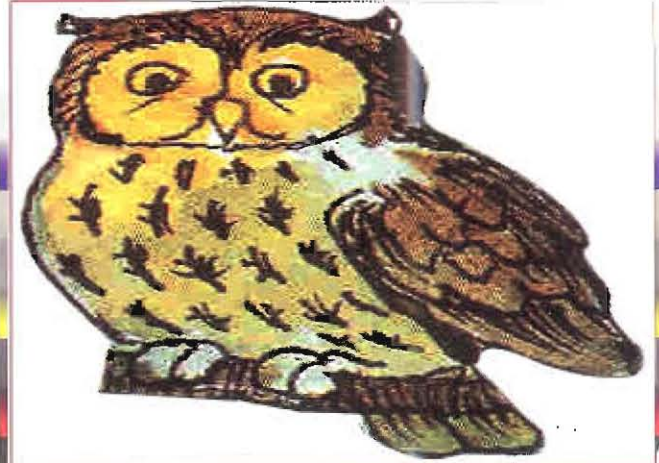
សត្វទីទុយស៊ីកណ្តុរ