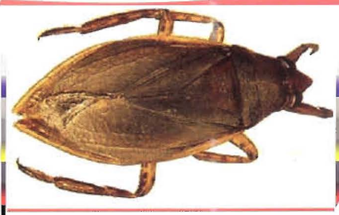
សត្វកន្ទាទុក

សត្វនៅក្នុងទឹកស្ទើរទាំងអស់ជាសត្វមានប្រយោជន៍ដូចជាស្រីងទឹកគ្រប់ប្រភេទ កន្ទាទុក កន្លេះឡុង ត្រី និងកង្កែប។ ជាធម្មតាសត្វក្នុងទឹកស៊ីសត្វល្អិតផ្សេងៗដែលធ្លាក់ចូលទៅក្នុងទឹកជាអាហារ ដូច្នេះសម្រាប់ស្រែមានទឹកច្រើន ឬស្រែមានប្រព័ន្ធស្រោចស្រពត្រឹមត្រូវ មានលក្ខណៈងាយស្រួលក្នុងការគ្រប់គ្រងសត្វចង្រៃបំផ្លាញដំណាំព្រោះយើងអាចជួយធ្វើ