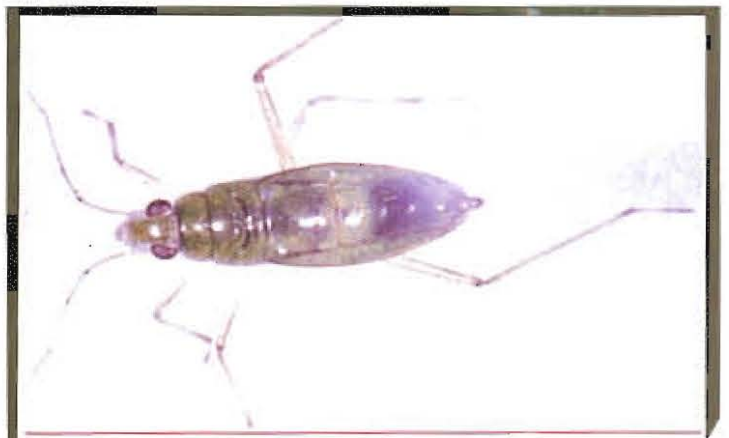
ស្រីងទឹកពោះកំប៉ោង