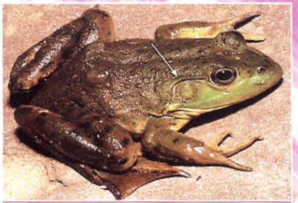
សត្វកង្កែប