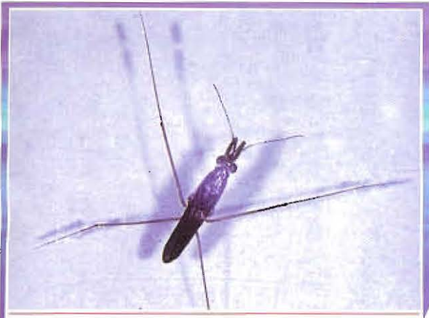
ស្រីងទឹកជើងវែង

អន្តរាគមន៍ដោយពន្លឺច ឬគោរៈដើមស្រូវឲ្យធ្លាក់សត្វល្អិតទៅក្នុងទឹក។